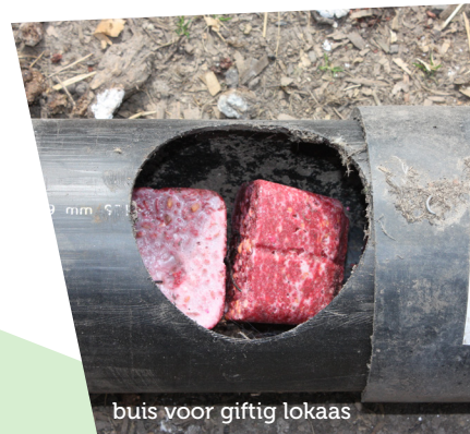
buis voor giftig lokaas