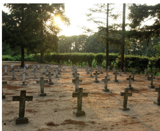
Begraafplaats Merksplas Kolonie