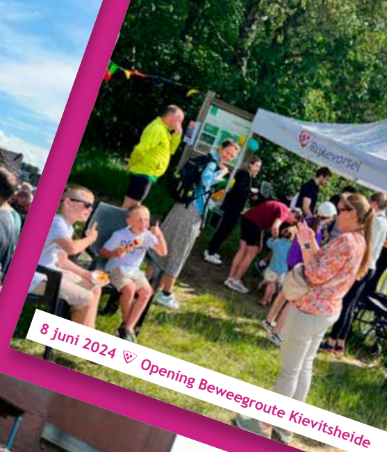
8 juni 2024 ♡ Opening Bewegroute Kievitsheide