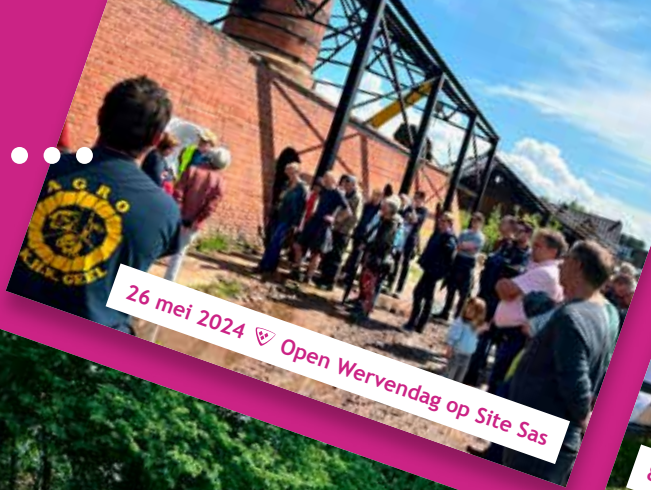
26 mei 2024 ♡ Open Wervendag op Site Sas