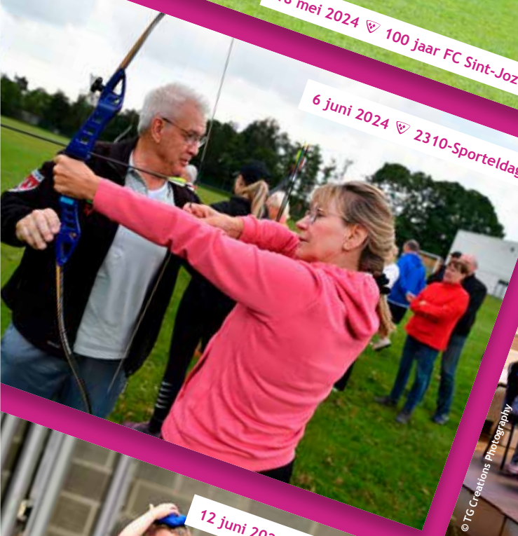
6 juni 2024 ♡ 2310-Sporteldag