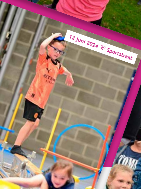
12 juni 2024 ♡ Sportstraat