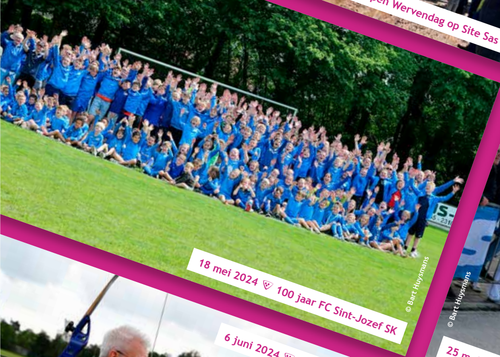
18 mei 2024 ♡ 100 jaar FC Sint-Jozef SK