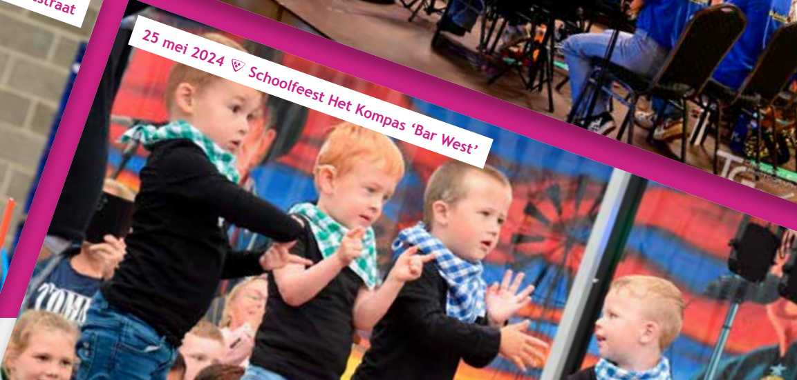
25 mei 2024 ♡ Schoolfeest Het Kompas 'Bar West'