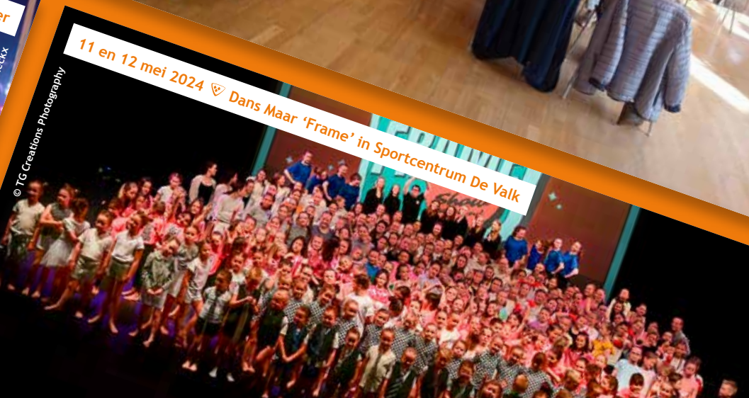
11 en 12 mei 2024 ♡ Dans Maar 'Frame' in Sportcentrum De Valk