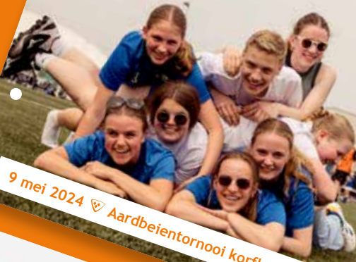
9 mei 2024 ♡ Aardbeienturnooi korfbalclub Rijko