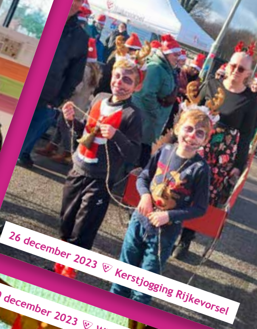
26 december 2023 ♡ Kerstjogging Rijkevorsel