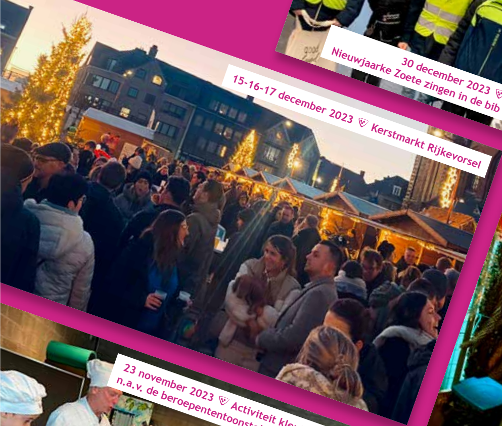
15-16-17 december 2023 ♡ Kerstmarkt Rijkevorsel