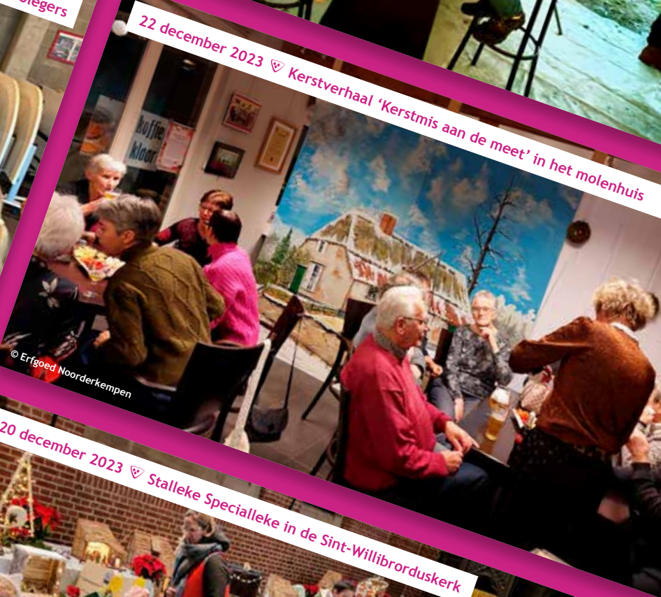
22 december 2023 ♡ Kerstverhaal 'Kerstmis aan de meet' in het molenhuis