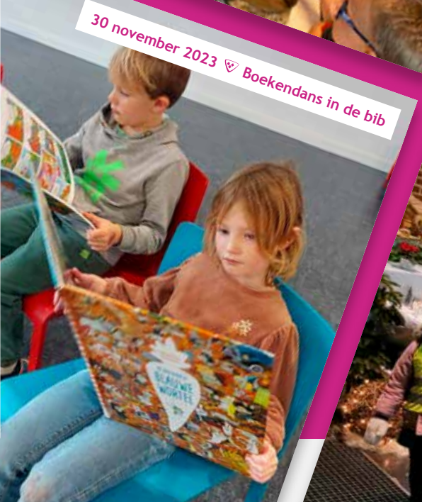
30 november 2023 ♡ Boekendans in de bib