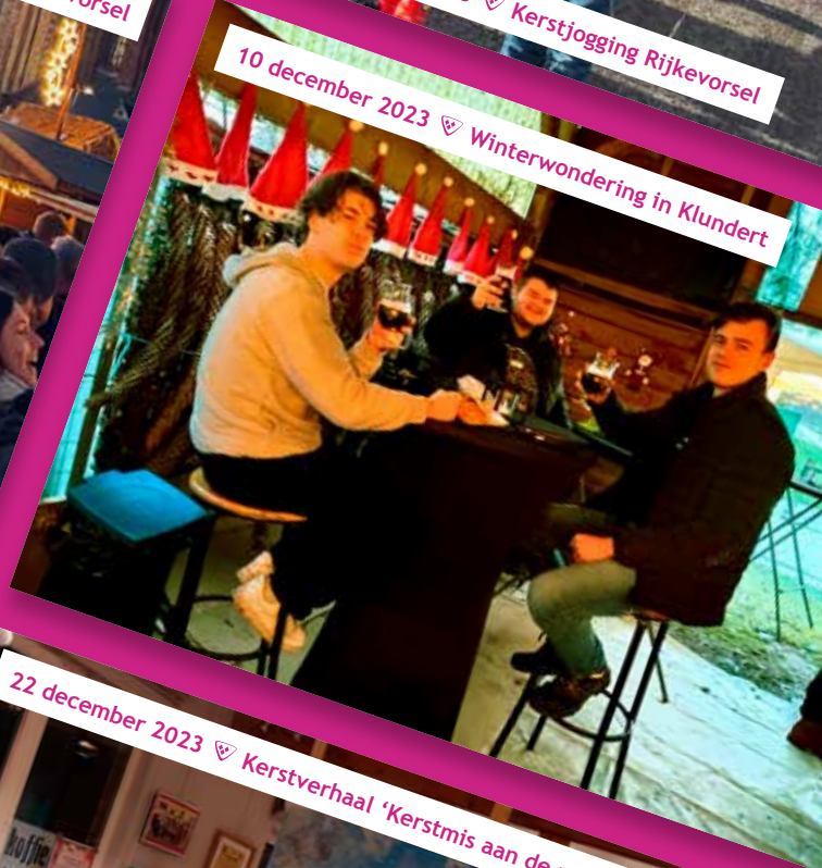
10 december 2023 ♡ Winterwondering in Klundert