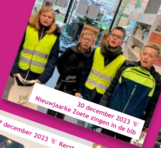
30 december 2023 ♡ Nieuwjaarse Zoete zingen in de bib