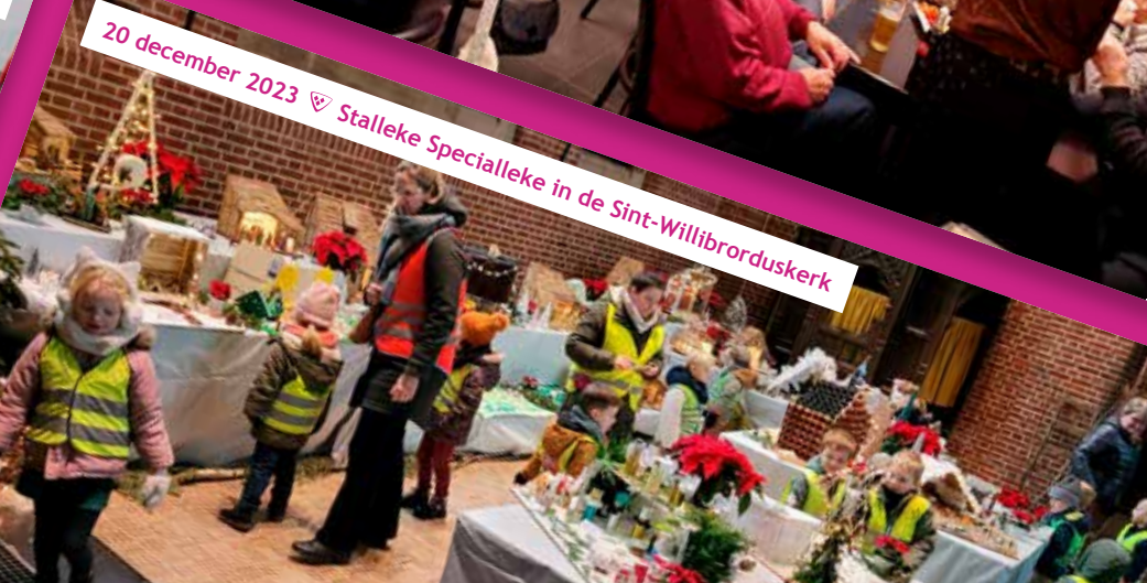
20 december 2023 ♡ Stalleke Specialeke in de Sint-Willibrorduskerk