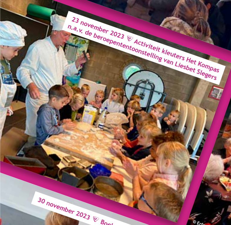
23 november 2023 ♡ Activiteit kleuters Het Kompas n.a.v. de beroepentoonstelling van Liesbet Slegers