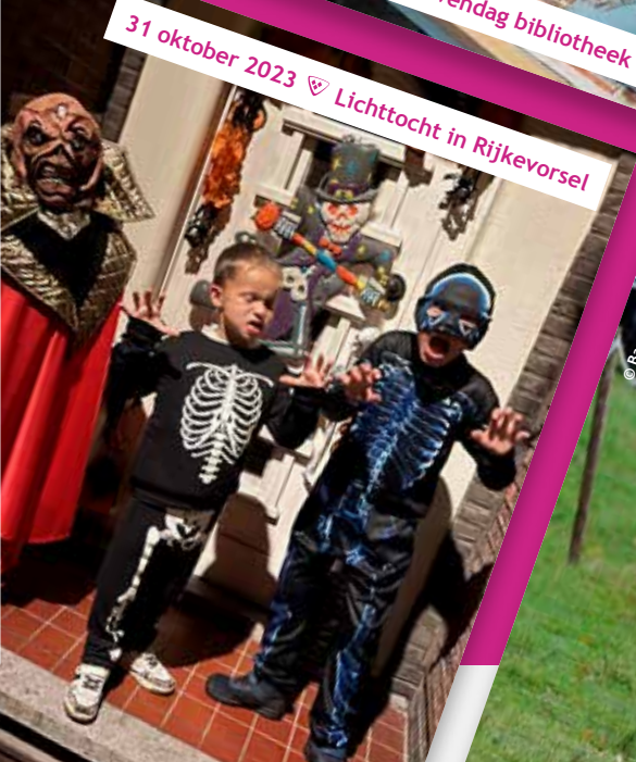
31 oktober 2023 ♡ Lichttocht in Rijkevorsel