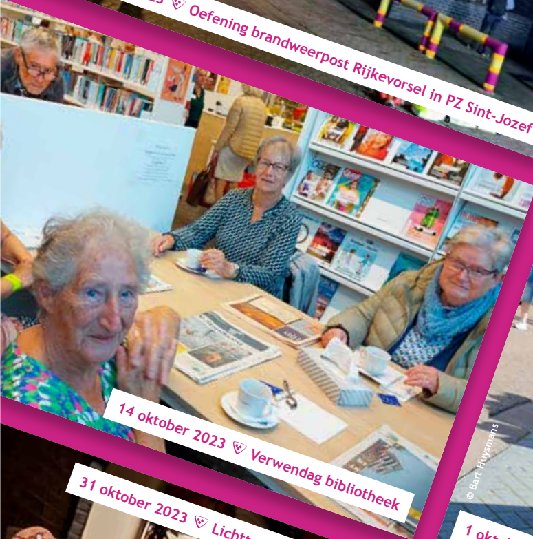
14 oktober 2023 ♡ Verwendag bibliotheek