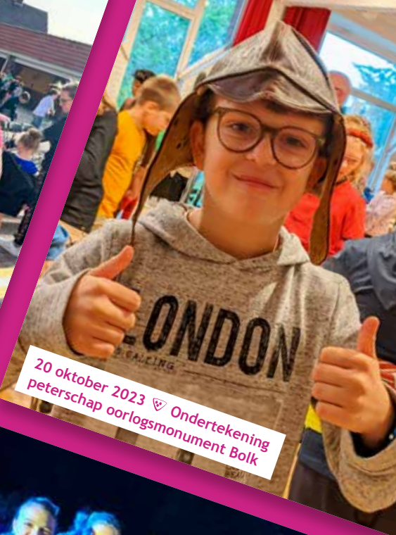
20 oktober 2023 ♡ Ondertekening peterschap oorlogsmonument Bolk