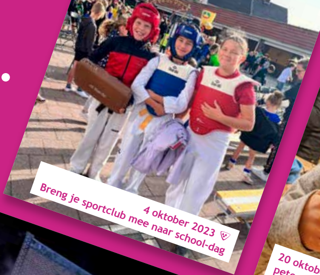
4 oktober 2023 ♡ Breng je sportclub mee naar school-dag