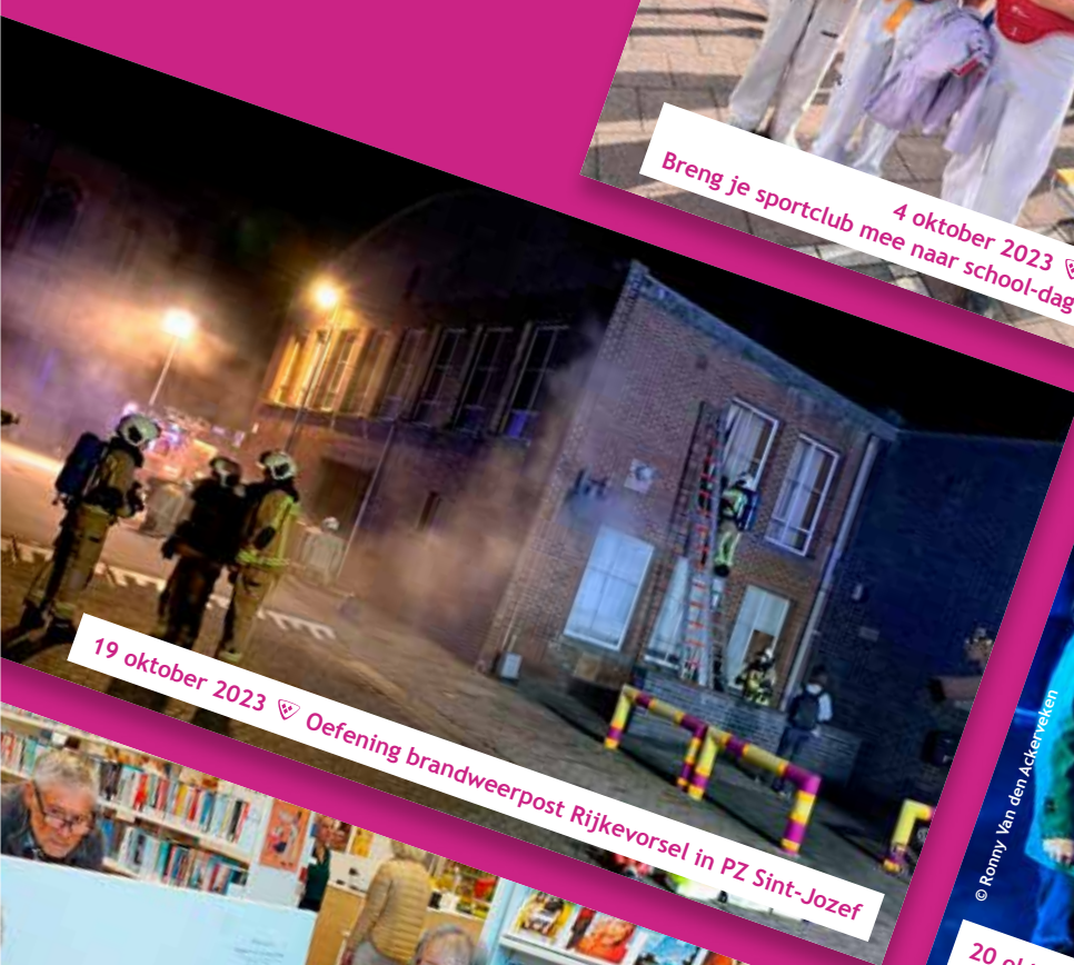
19 oktober 2023 ♡ Oefening brandweerpost Rijkevorsel in PZ Sint-Jozef