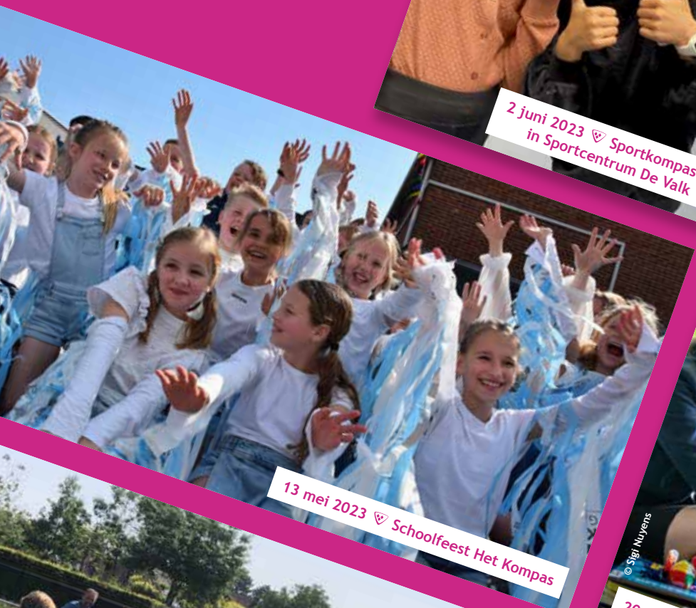
13 mei 2023 ♡ Schoolfeest Het Kompas