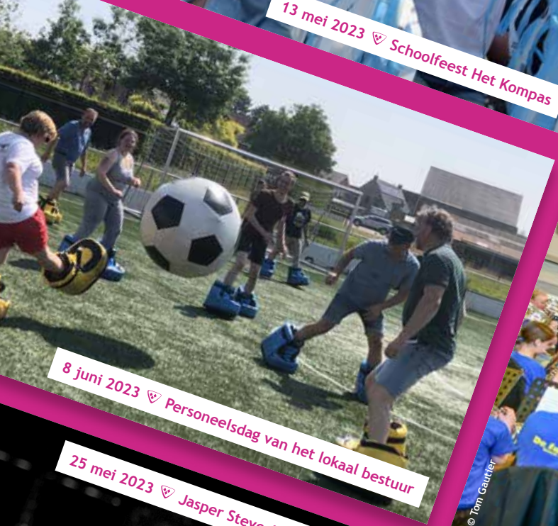
8 juni 2023 ♡ Personeelsdag van het lokaal bestuur