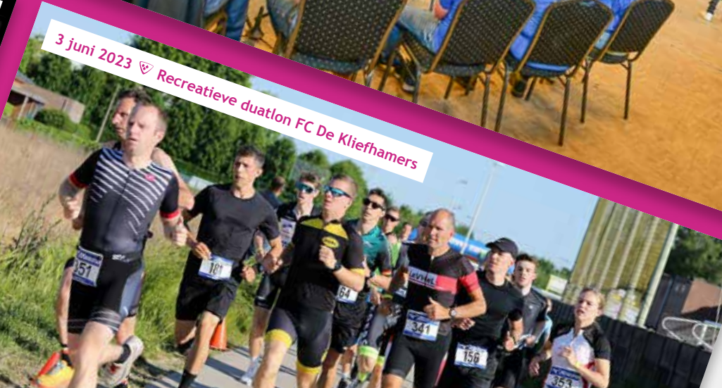
3 juni 2023 ♡ Recreatieve duatlon FC De Kliefhamers