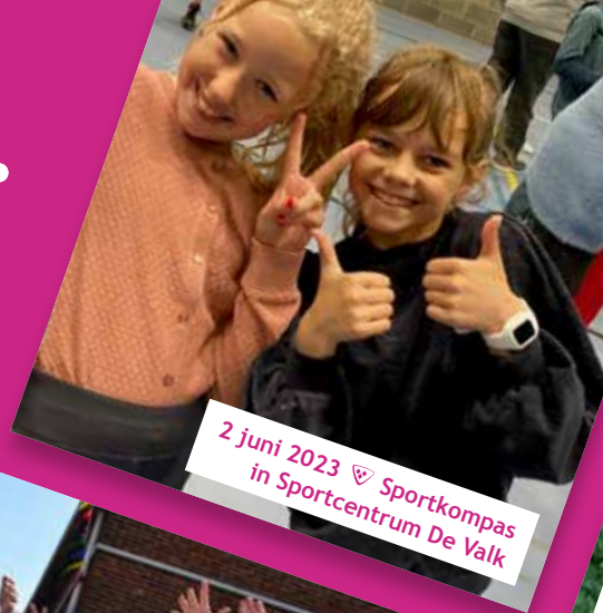
2 juni 2023 ♡ Sportkompas in Sportcentrum De Valk