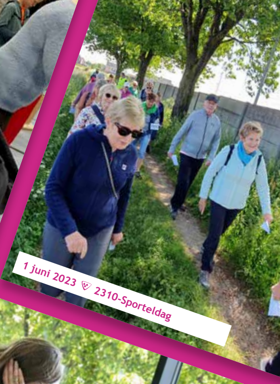
1 juni 2023 ♡ 2310-Sporteldag