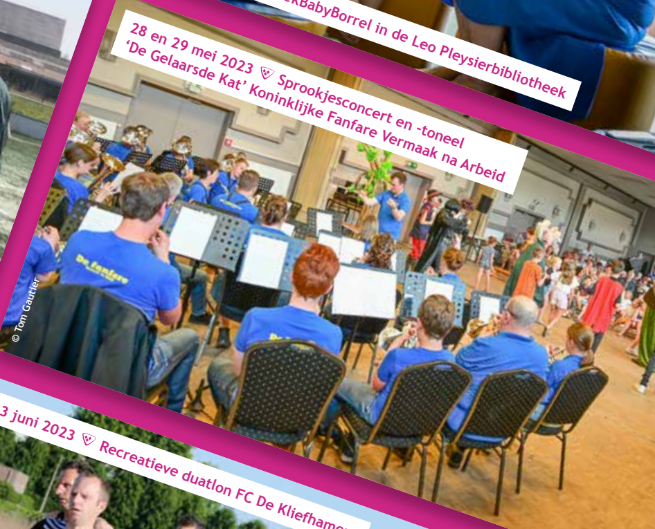
28 en 29 mei 2023 ♡ Sprookjesconcert en -toneel 'De Gelaarsde Kat' Koninklijke Fanfare Vermaak na Arbeid