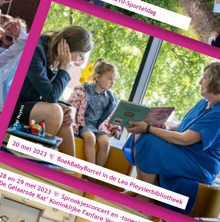
20 mei 2023 ♡ BoekBabyBorrel in de Leo Pleysierbibliotheek