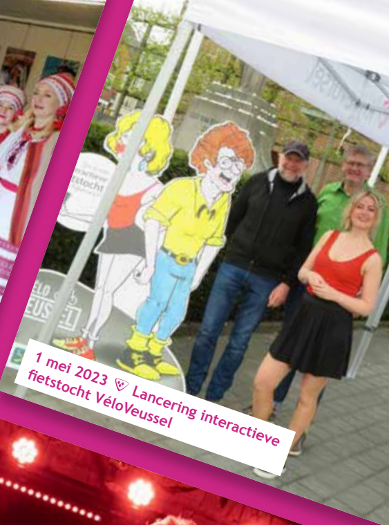
1 mei 2023 ♡ Lancering interactieve fietstocht VéloVeussel