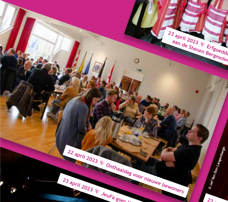
22 april 2023 ♡ Onthaaldag voor nieuwe bewoners