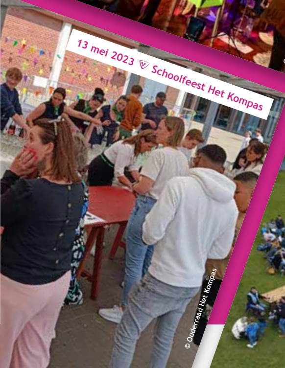
13 mei 2023 ♡ Schoolfeest Het Kompas