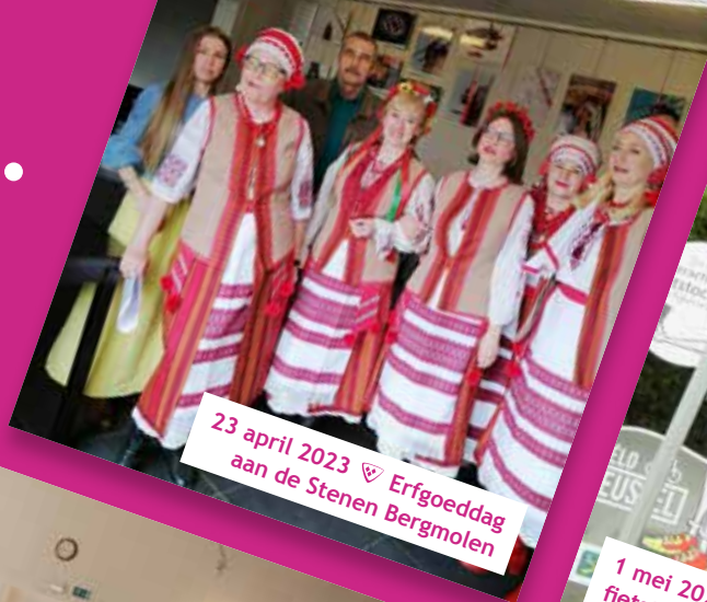
23 april 2023 ♡ Erfgoeddag aan de Stenen Bergmolen