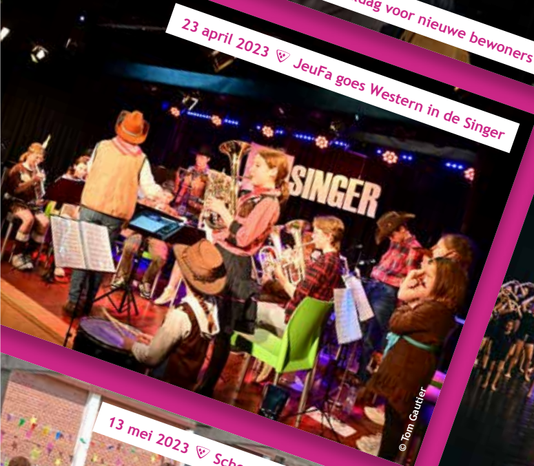
23 april 2023 ♡ JeuFa goes Western in de Singer