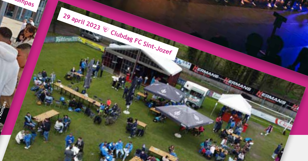
29 april 2023 ♡ Clubdag FC Sint-Jozef